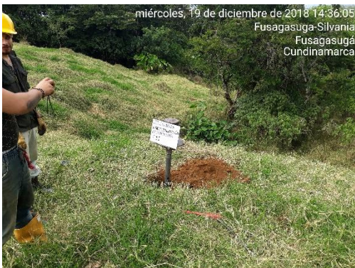
miércoles, 19 de diciembre de 2018 14:36:05 Fusagasuga-Silvania Fusagasuga Cundinamarca