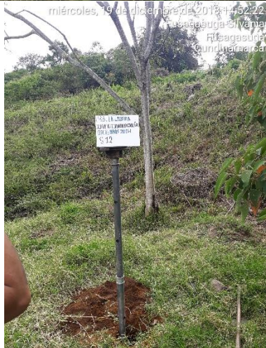
miércoles, 19 de diciembre de 2018 14:52:22 Fusagasuga-Silvania Fusagasuga Cundinamarca