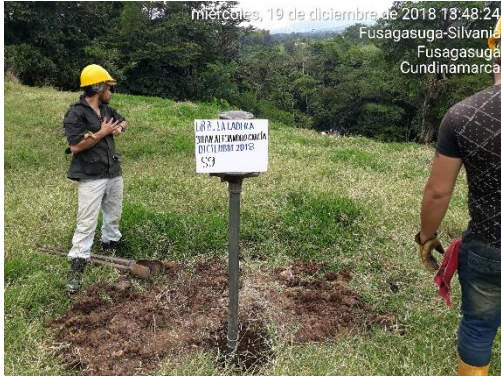
miércoles, 19 de diciembre de 2018 13:48:24 Fusagasuga-Silvania Fusagasuga Cundinamarca