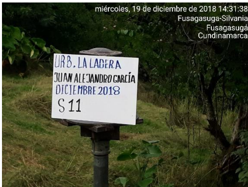
miércoles, 19 de diciembre de 2018 14:31:38 Fusagasuga-Silvania Fusagasuga Cundinamarca