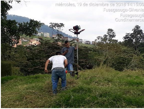
miércoles, 19 de diciembre de 2018 14:15:00 Fusagasuga-Silvania Fusagasuga Cundinamarca