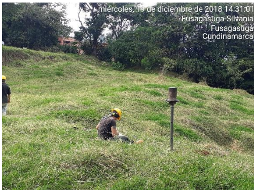
miércoles, 19 de diciembre de 2018 14:31:01 Fusagasuga-Silvania Fusagasuga Cundinamarca