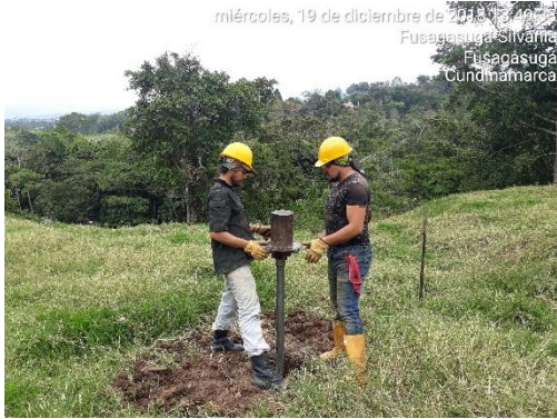
miércoles, 19 de diciembre de 2018 14:09:55 Fusagasuga-Silvania Fusagasuga Cundinamarca