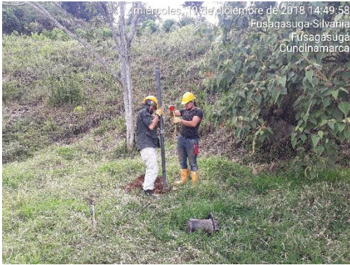
miércoles, 19 de diciembre de 2018 14:49:58 Fusagasuga-Silvania Fusagasuga Cundinamarca